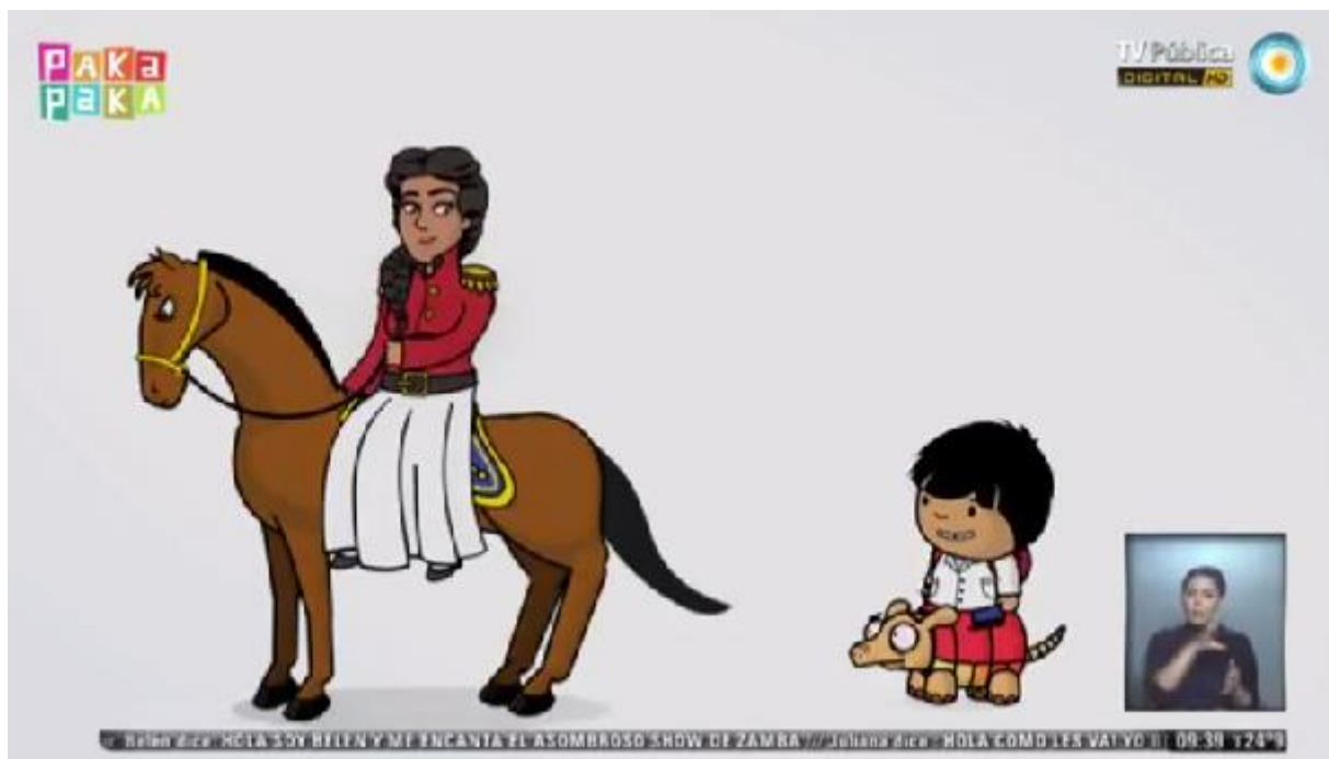
Imagen del dibujo animado de Juana Azurduy junto al personaje infantil "Zamba".