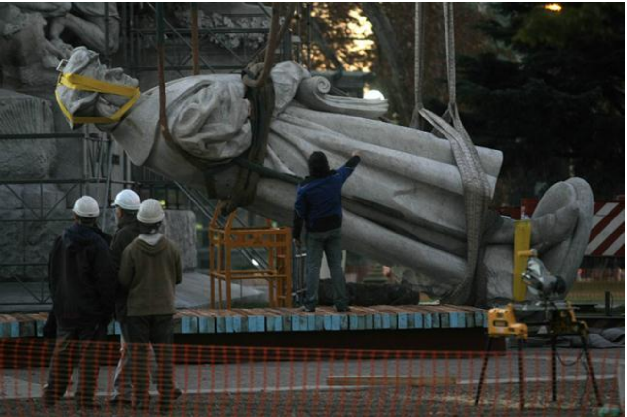
La estatua de Colón cayendo. 29 junio de 2013