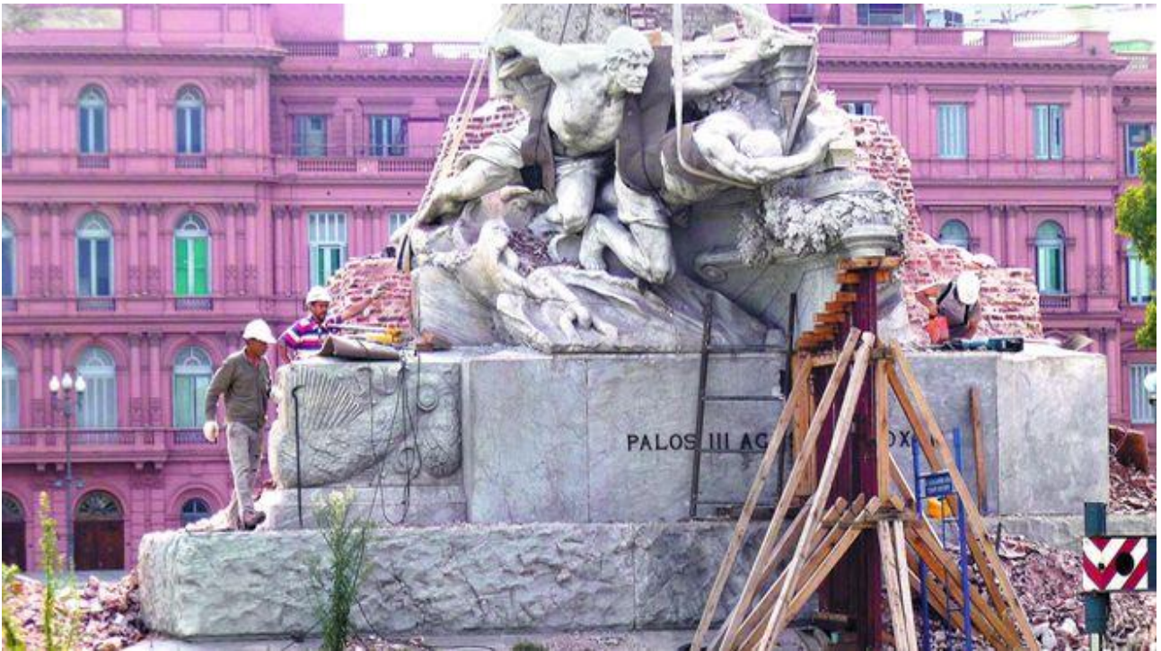
Desmonumentación de Colón.