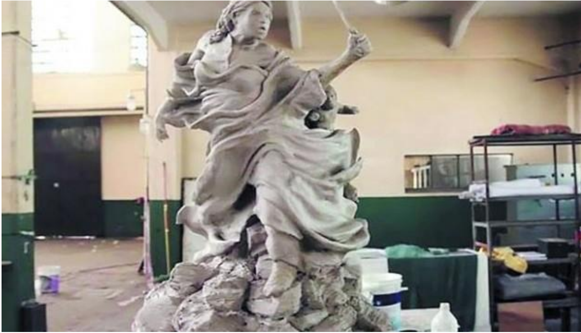
Modelo de la estatua de Juana Azurduy. Fuente: Noticias Urbanas. 10 de junio de 2013