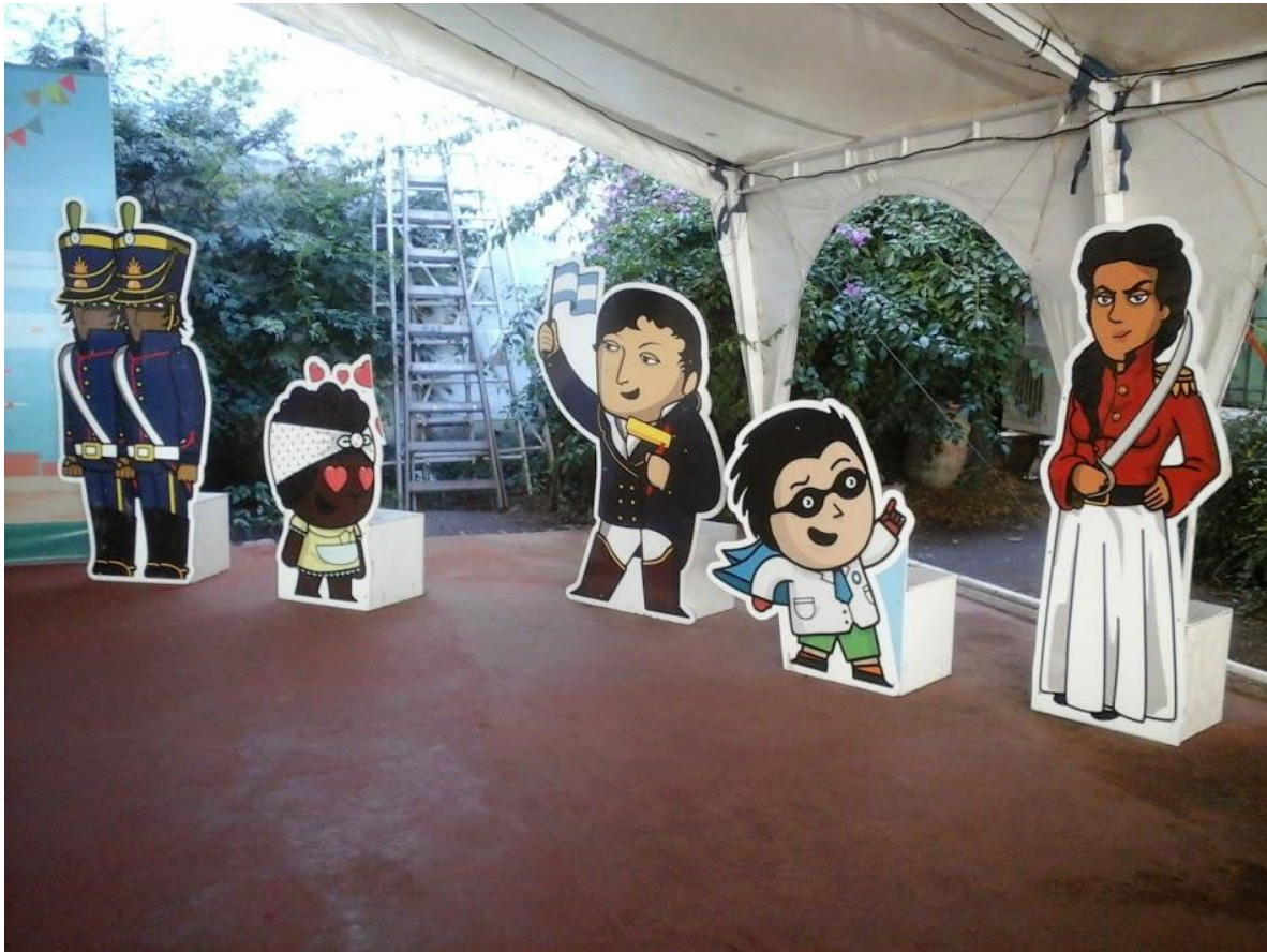
Patio del Cabildo. Juana Azurduy junto a Manuel Belgrano junto a 2 personajes centrales de la señal estatal infantil Paka Paka. Abril 2015.