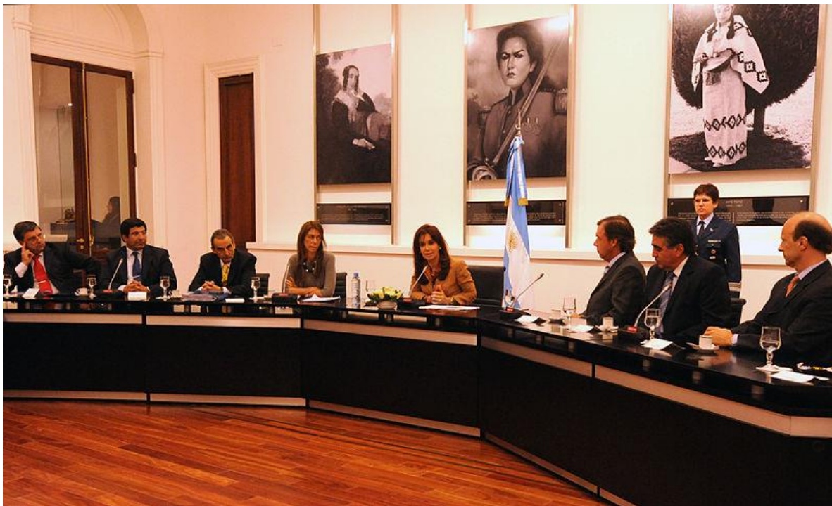
Juana Azurduy en el Salón de las Mujeres Argentinas de la Casa Rosada, inaugurado durante la gestión presidencial de Cristina de Kirchner.