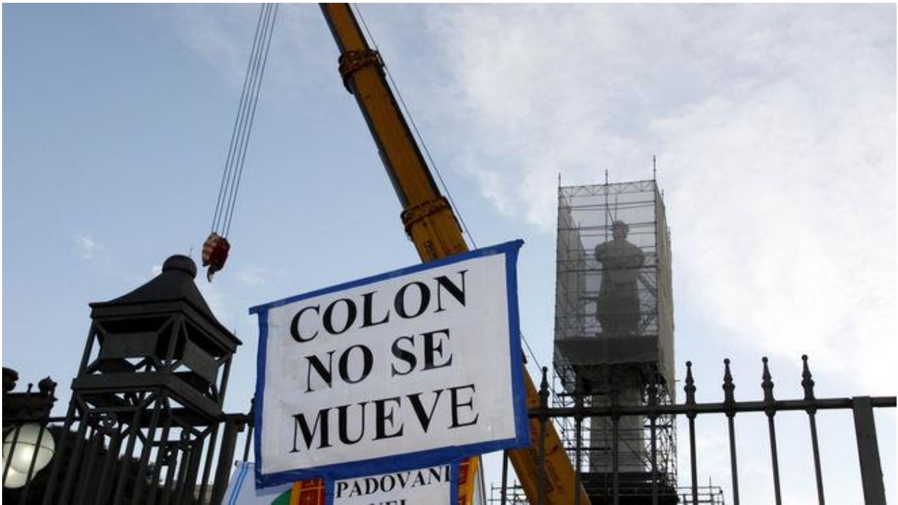
Cartel en repudio del desmonte en marcha del monumento a Colón.