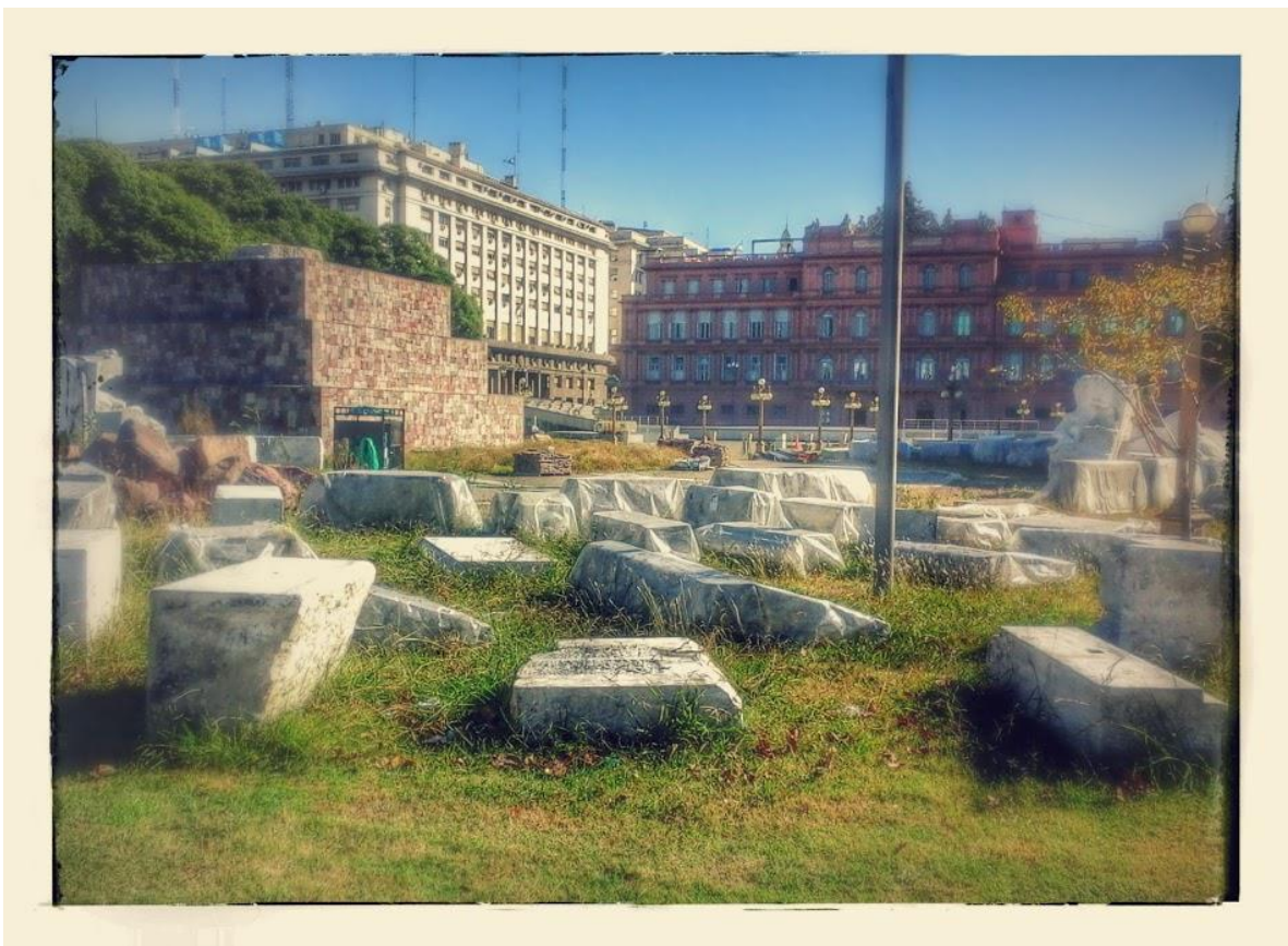
Monumento a Colón hoy. Desmenbrado y semiembalado por partes, en bolsas.