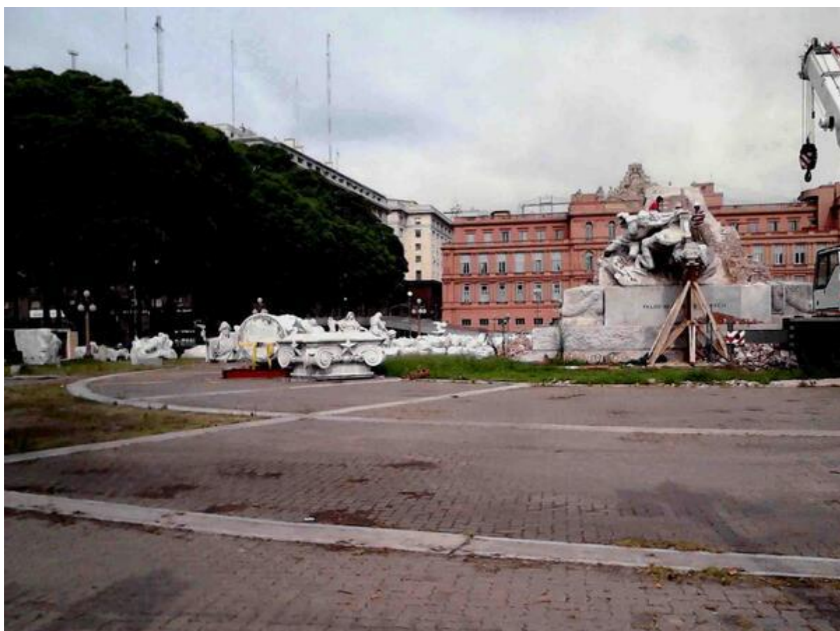
22 de febrero de 2014.