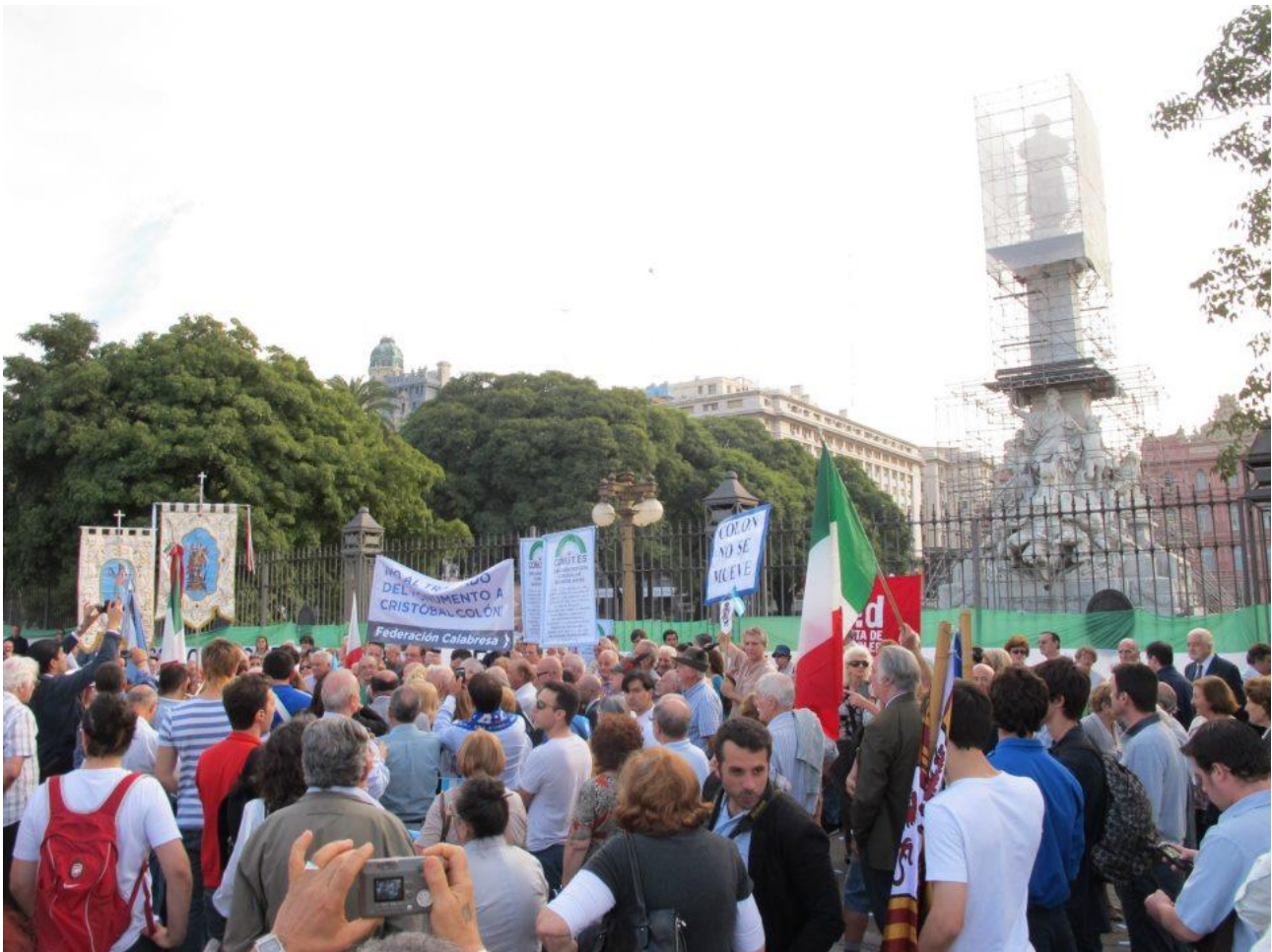
Protesta frente al monumento, frente al inminente traslado.