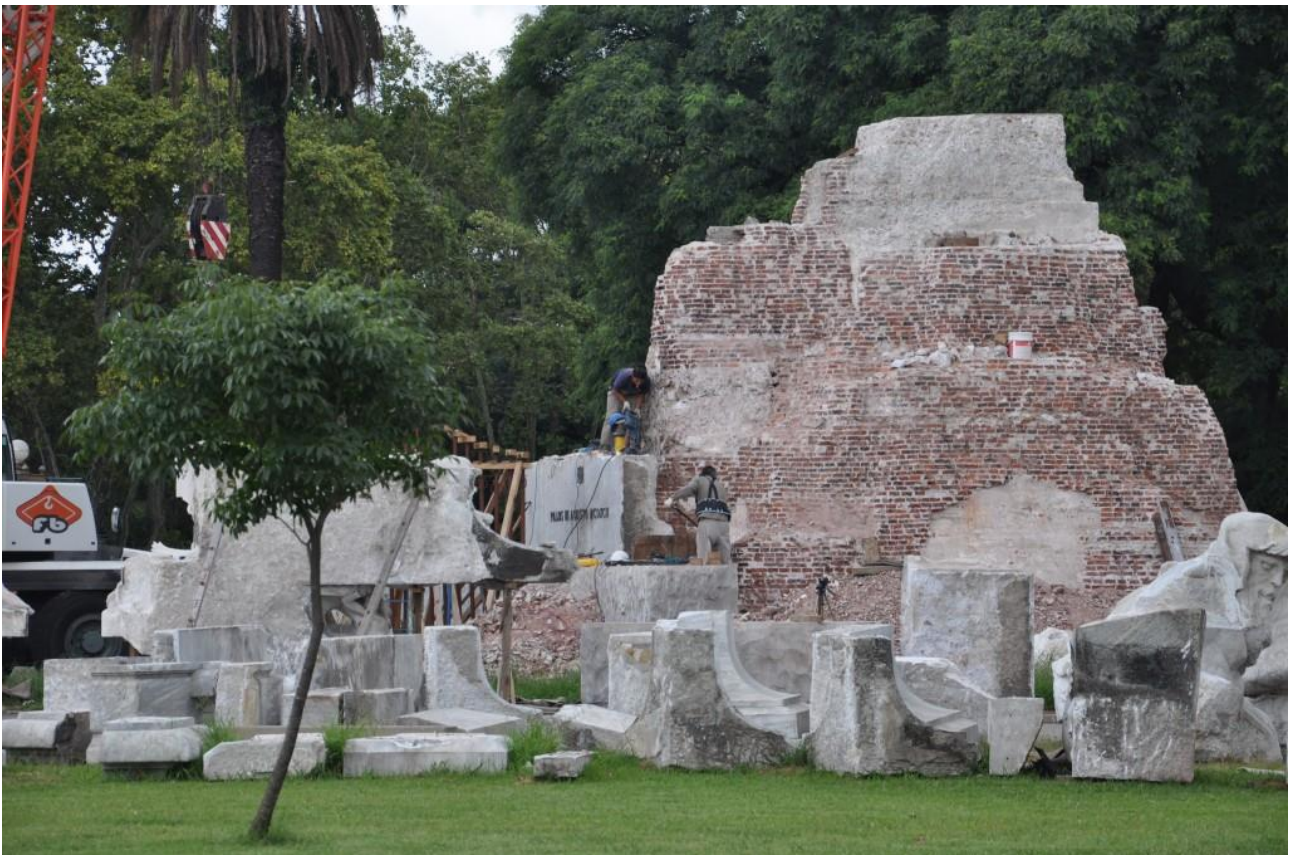
Obreros desmantelando la base original. 8 de mayo de 2014