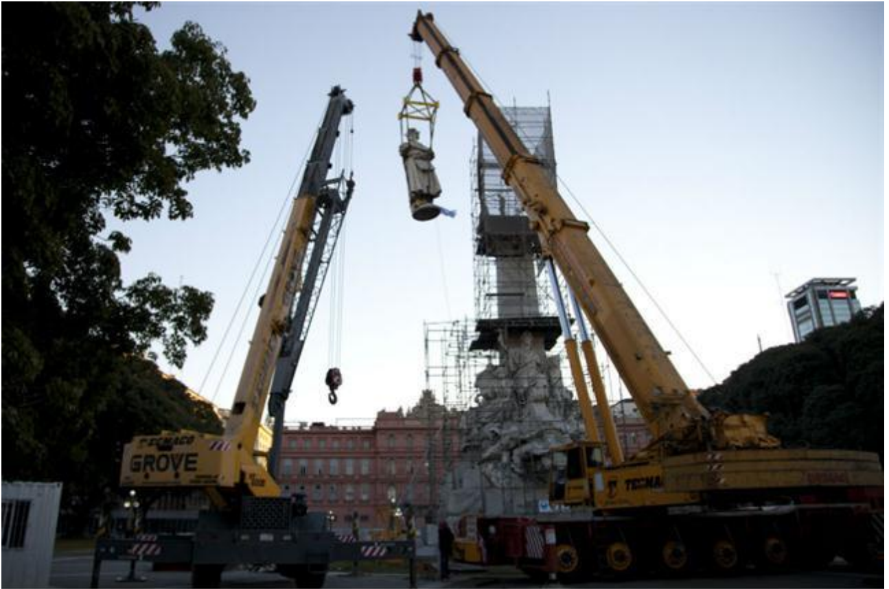
Bajando a Colón. 29 junio de 2013