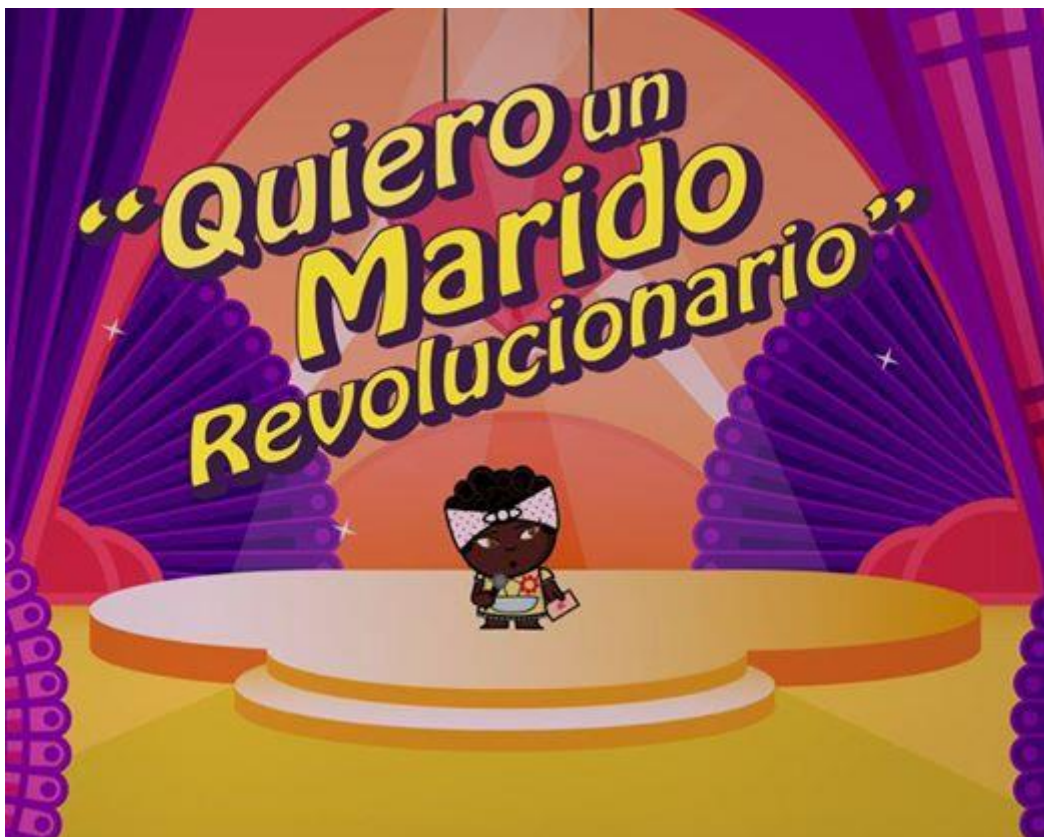
Bajando línea por el canal estatal infantil Paka-Paka.