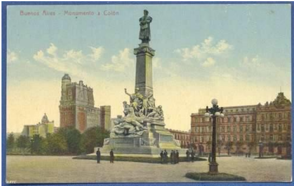
Postal del Monumento a Colón. 1935