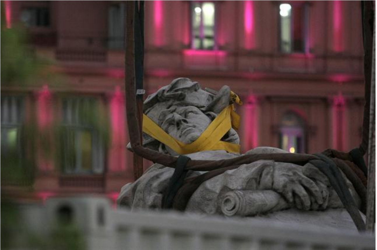
Junio de 2013